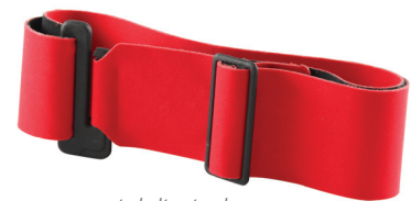
custo belt extender