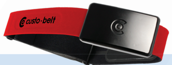
custo belt 1 Elektrodenurt mit custo guard 1 EKG-Sender

Ihr autorisierter custo med Vertriebspartner