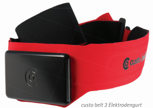
custo belt 3 Elektrodenurt mit custo guard 3 EKG-Sender